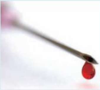
一针见血 仿若无痛

静脉针、管塞针皆采用优质医用不锈钢管制作，钢性韧性十足，管壁光滑；针尖采用多斜面设计，先进工艺打磨，边缘平滑，针尖锋利；高品质的的润滑剂可以减少穿刺所造成的阻力，降低对皮肤的损伤和痛感。