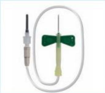
国际通用 安全标准

静脉针、管塞针皆采用优质医用不锈钢管制作，钢性韧性十足，管壁光滑；针尖采用多斜面设计，先进工艺打磨，边缘平滑，针尖锋利；高品质的的润滑剂可以减少穿刺所造成的阻力，降低对皮肤的损伤和痛感。