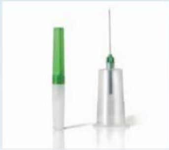
刚柔并济 性能卓越

采用国际标准的鲁尔口设计，方便与持针器组合，双重安全；采用双翼设计，操作固定更稳固。